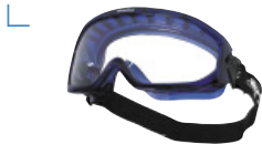
BLASPI - BLEPSI - BLARSI