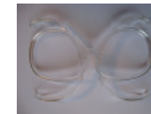
SOS BLAST RX-Adapter in grilamide für BLAST