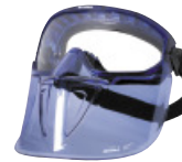
BLAST + BLV