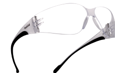
BANXSCI Ohne Brillenband

Kratz feste, beschlagfreie und anti-statische Behandlung (je nach Version)