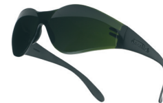
BANWPCC5 Ohne Brillenband